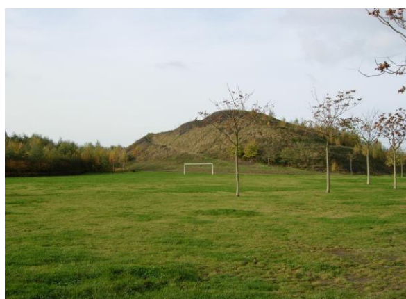
Parc St Rock

- Le parc « St Roch » comportant un terrain de foot, un terrain de basket, une aire de jeux, un skate parc, une grande étendue d'herbe, le terril et les chemins de marche aux alentours