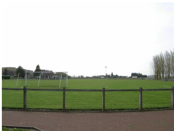
Stade Daniel Leclercq